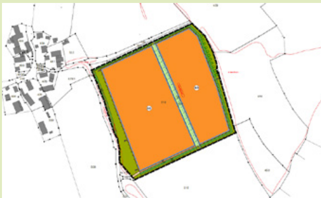
Vorhabenbezogener Bebauungsplan „Solarpark Preußling“

Weiterhin werden je 4 Holz- und Steinhäufen und 4 „Insektenhotels“ für Insekten und Reptilien sowie 2 Spazierbänke und ein Lehrpfad angelegt.