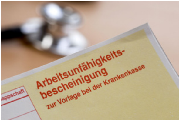
Die Krankmeldung auf Papier – umgangssprachlich der „Gelbe Schein“ – wird ersetzt durch die eAU.